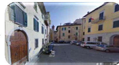
Via San Giuseppe e poi Via S.Apollonia

Percorrete tutta la strada obbligata lungo il senso unico, e dopo circa 300 metri vi troverete in Via S.Apollonia e poco più avanti siete arrivati all'albergo!