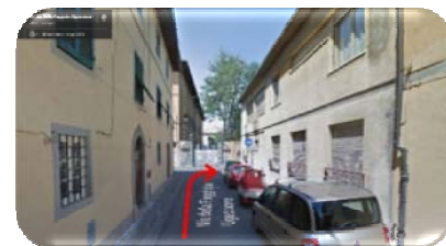
Via della Faggiola

Percorrete Via Della Faggiola ed alla fine della strada girate a destra