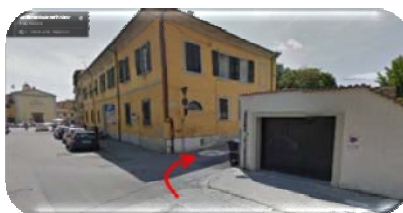
Per via San Tommaso

Seguire il senso unico di VIA CARDINALE MAFFI , quindi quasi in fondo alla strada girare a destra in Via SAN TOMMASO