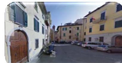
Via San Giuseppe e poi Via S. Apollonia

Percorrete tutta la strada obbligata lungo il senso unico, e dopo circa 300 metri vi troverete in Via S. Apollonia e poco più avanti siete arrivati all'albergo!