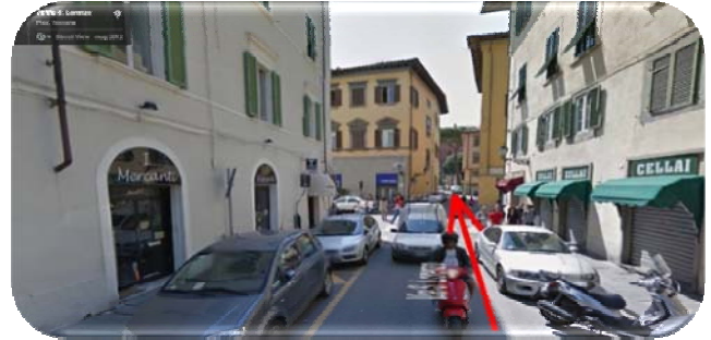
Via San Lorenzo

Appena vi siete immessi in Via San Lorenzo , dovrete andare sempre dritto, fino a raggiungere un incrocio, dove continuerete ad andare dritto. Non fate caso al senso unico nella fotografia in quanto da poco il senso è stato invertito