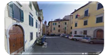
Via San Giuseppe e poi Via S. Apollonia

Percorrete tutta la strada obbligata lungo il senso unico, e dopo circa 300 metri vi troverete in Via S. Apollonia e poco più avanti siete arrivati all'albergo!