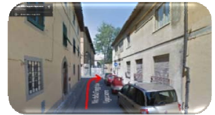
Via della Faggiola

Percorrete Via Della Faggiola ed alla fine della strada girate a destra