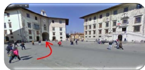
Piazza dei Cavalieri

Proseguite sempre dritto e dopo circa 400 metri raggiungerete Piazza dei Cavalieri , in fondo alla quale dovrete svoltare a sinistra sotto l'arco per entrare in Via della Faggiola