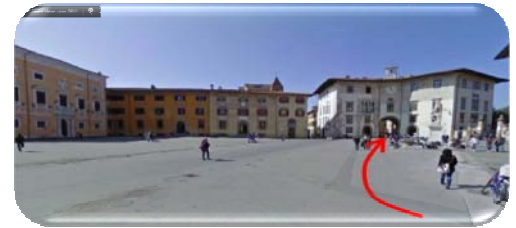
Piazza dei Cavalieri

Proseguite sempre dritto e dopo circa 400 metri raggiungerete Piazza dei Cavalieri , in fondo alla quale dovrete svoltare a sinistra sotto l'arco per entrare in Via della Faggiola