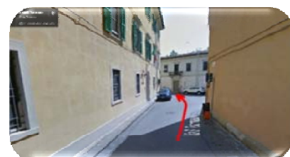
Via San Tommaso

La strada porta obbligatoriamente a sinistra in VIA CAPPONI , nella quale vi immetterete e sarete in VIA SAN GIUSEPPE